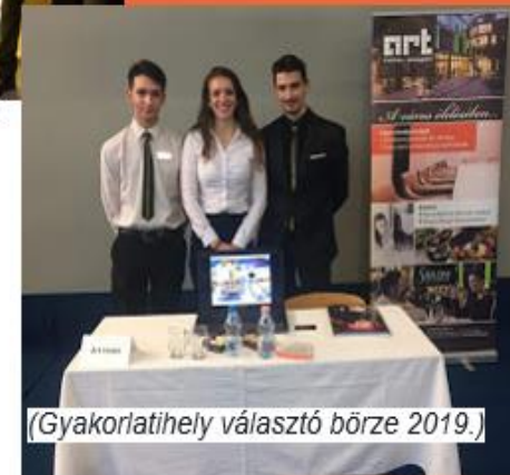
(Gyakorlatihely választó börze 2019.)