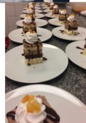
( Somlói kočka 2018.július)