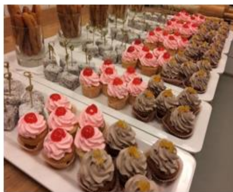
(Édes bekészítés 2018. július.)