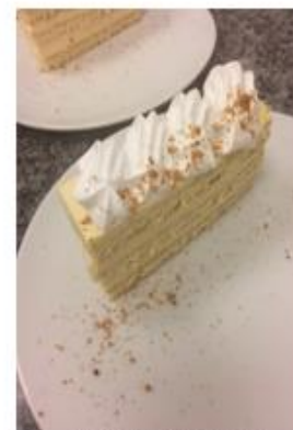
( Madártej szelet 2018.július)