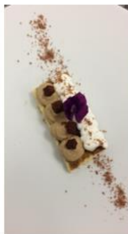
( Tiramisu szelet 2017. július.)