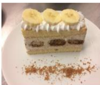
( Banános tiramisu 2018. július)